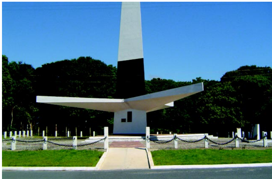
Ponta do Seixas.