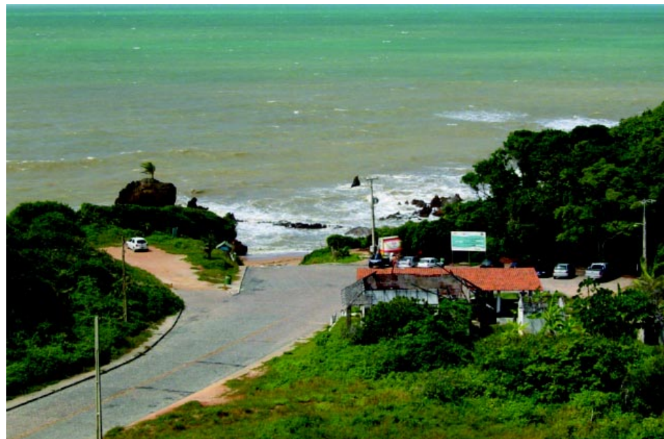
Praia de Tambaba.

Uma das capitais mais visitadas do Nordeste, João Pessoa oferece muitos atrativos para os turistas: Belíssimas praias, restaurantes de culinária típica da região, calor durante quase todo ano e uma curiosidade, nas proximidades do centro da cidade está localizado o ponto mais oriental do continente, a Ponta do Seixas.