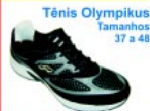
Tênis Olympikus Tamanhos 37 a 48