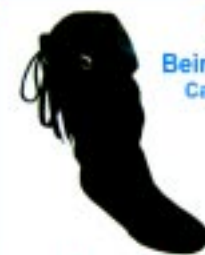
Bota Beira Rio Camurça