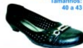
Sapato Revirê Tamanhos: 40 a 43