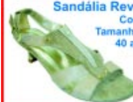
Sandália Revirê Couro Tamanhos: 40 a 43