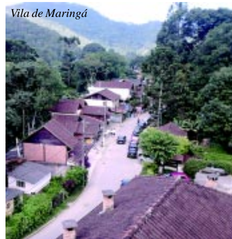
Vila de Maringá

Mais informações: www.casadaciencia.ufrj.br