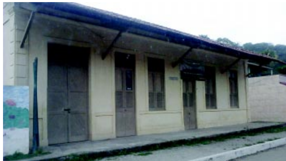
Antiga estação ferroviária.

O antigo cemitério, embora de grande valor histórico, encontra-se, atualmente, mal preservado. Na sua frente há uma torre da mesma época que moradores dizem ter pertencido a uma igreja. Para acessar o local, o visitante que seguir da Via Dutra para o centro de Tinguá deve