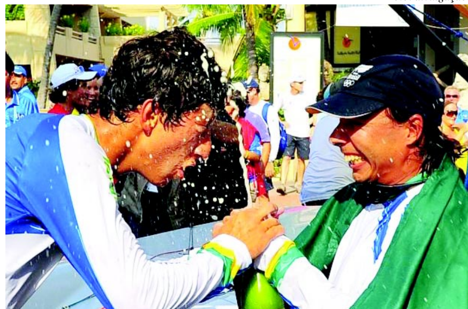
Velejadores recebem premiação.

AT - Comecei a velejar no optimist com 13 anos através da escolinha de vela, passei pelas classes laser ate chegar ao snipe, que é uma classe que tem fabricação 100% brasileira, de custo mais baixo e de boa qualidade. Velejei alguns anos como proeiro, para aprender com os melhores velejadores do país. Comecei a aplicar os conhecimentos em 2005, quando iniciei como timoneiro do barco. Atualmente sigo no snipe e com certeza