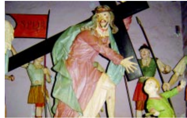
A Via Sacra, obra de Aleijadinho.