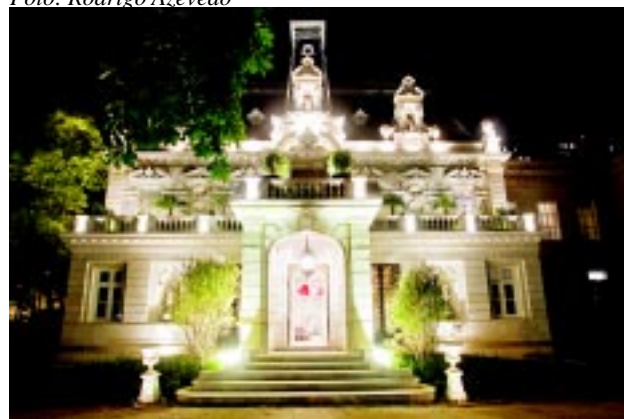
Fachada/Projeto Luminotécnico, por Widimar Ligeiro.

Será que foi para contrastar com a delicadeza de detalhes da arquitetura do imóvel que arquitetos apostaram nos materiais brutos e rústicos? Sofá e mesa feitos em pedra (Alessandro Sartore), bancos de troncos (Paula Bergamin) e mesa de jantar de madeira maciça (Paola Ribeiro), bancos em cimento de Zanini de Zanine (Leila Dionizio). Enferujado, o aço corten está na chaminaria (luminárias, garrafas), no Deca Garden Lounge (pilares e teto), na parede flutuante (Izabela Lessa), Jardim dos Pavilhões (jardim vertical), Café (que, aliás, também usa piso cimentício e madeira de demolição).