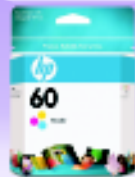
CARTUCHO HP 60 COLOR R$ 44,90