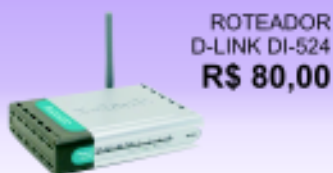
ROTEADOR D-LINK DI-524 R$ 80,00

Recarregue o cartucho 4 vezes e a 5ª é grátis