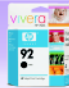
CARTUCHO HP 92 PRETO R$ 35,00