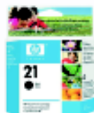
CARTUCHO HP 21 PRETO R$ 35,00