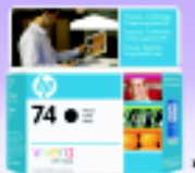
CARTUCHO HP 74 PRETO R$ 35,00