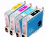
CARTUCHO EPSON COMPATÍVEIS a partir de R$ 9,90