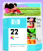
CARTUCHO HP 22 R$ 44,90