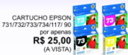
CARTUCHO EPSON 731/732/733/734/117/ 90 por apenas R$ 25,00 (A VISTA)