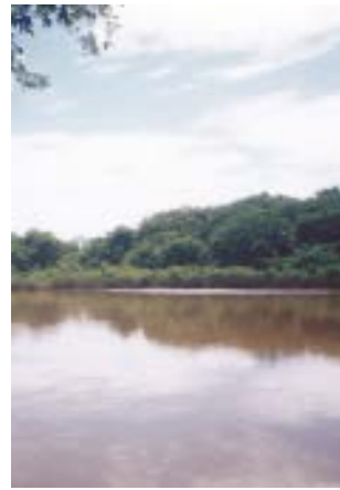
Rio Miranda

Pantanal mato-grossense reúne flora e fauna singulares