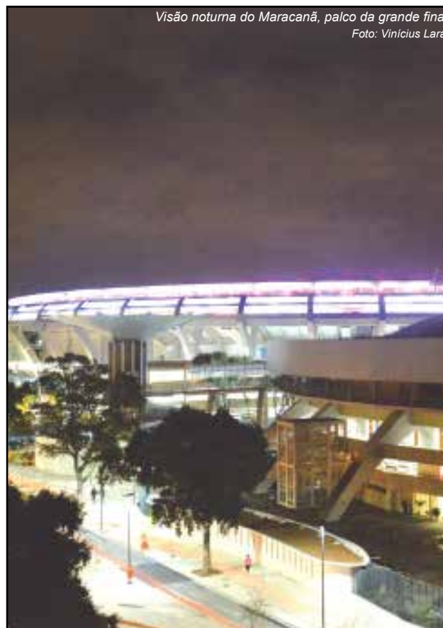
Visão noturna do Maracanã, palco da grande final

As seleções que despontam como favoritas para conquistar a Copa das Confederações são Brasil, Espanha, Itália e Uruguai. Nossa seleção não vem apresentando um belo futebol, até mesmo vem sofrendo bastante nos últimos amistosos