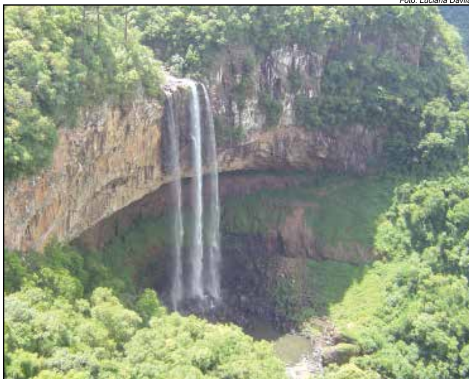
Majestosa Cascata do Caracol: com 130 metros de altura, é o maior símbolo da cidade de Canela

Vizinha de outra famosa cidade turística, Gramado, a acolhedora cidade conta atualmente com cerca de 45 mil habitantes. Além de suas próprias belezas, Canela também é bastante procura-