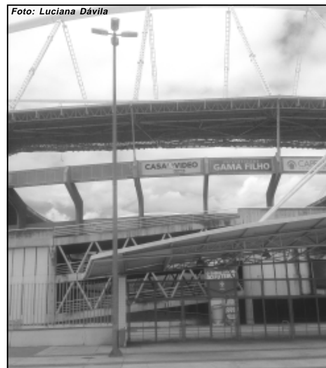
Engenhão: palco dos clássicos do futebol do Rio sem o Maracanã

O Botafogo e o Fluminense são clubes que poderiam render mais nesse quesito também. Ambos, assim como Vasco da Gama, foram eliminados também precocemente na Copa São