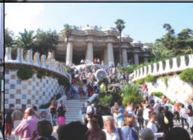
Em sentido horário, a partir da foto superior à esquerda: Templo da Sagrada Família, Praia de Barceloneta, Parc Güell e centro da cidade

população de Barcelona souberam explorar a escolha do Comitê Olímpico Internacional e transformaram sua cidade em uma das mais visitadas do Velho Continente.