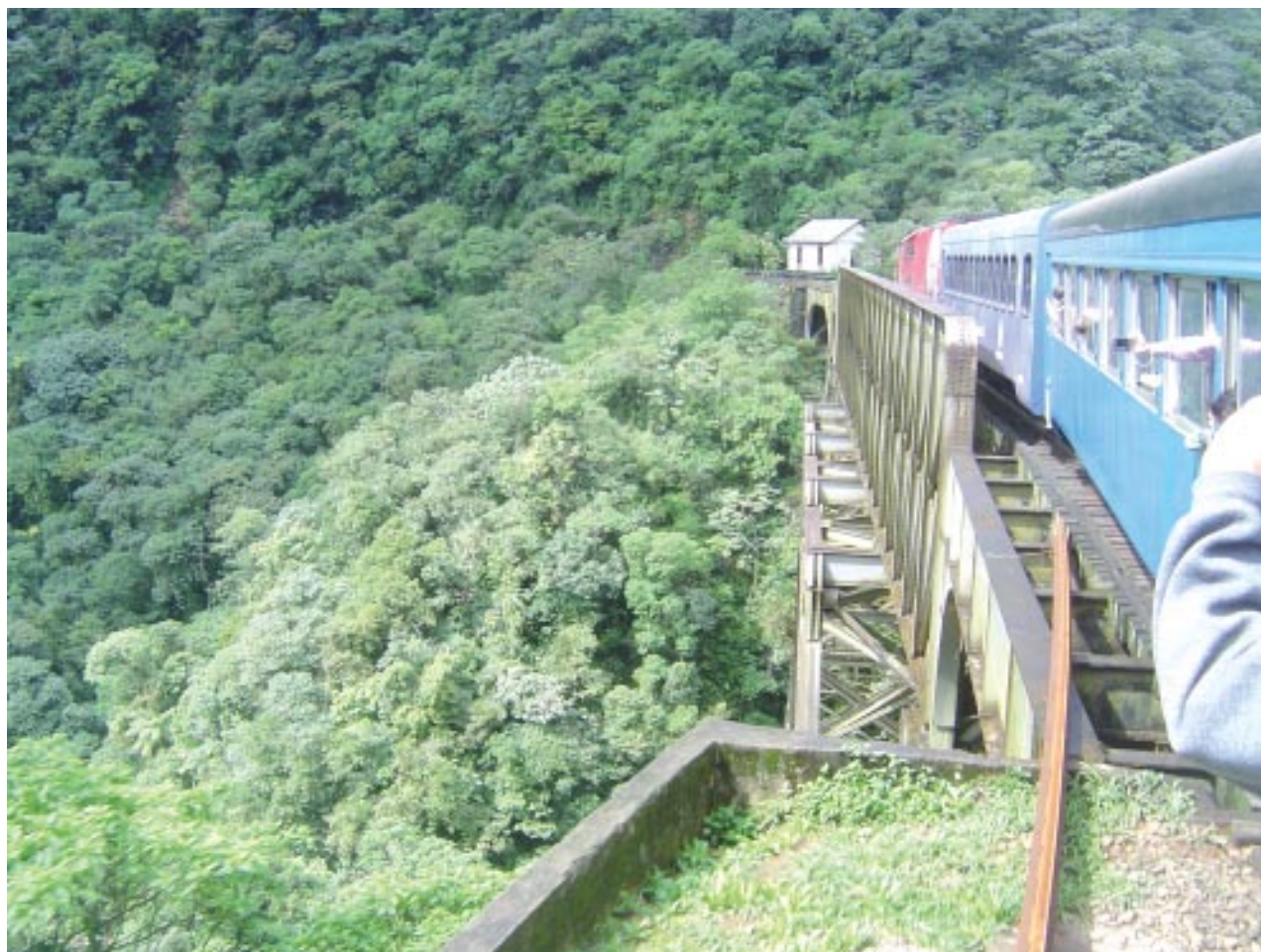
Trem que realiza o passeio turístico Curitiba-Morretes desde a Serra do Mar: comunhão da natureza com a engenharia do homem

e gastronômicas para os turistas durante todas as estações do ano sem nunca inovações urbanas e as preocupações ecológicas