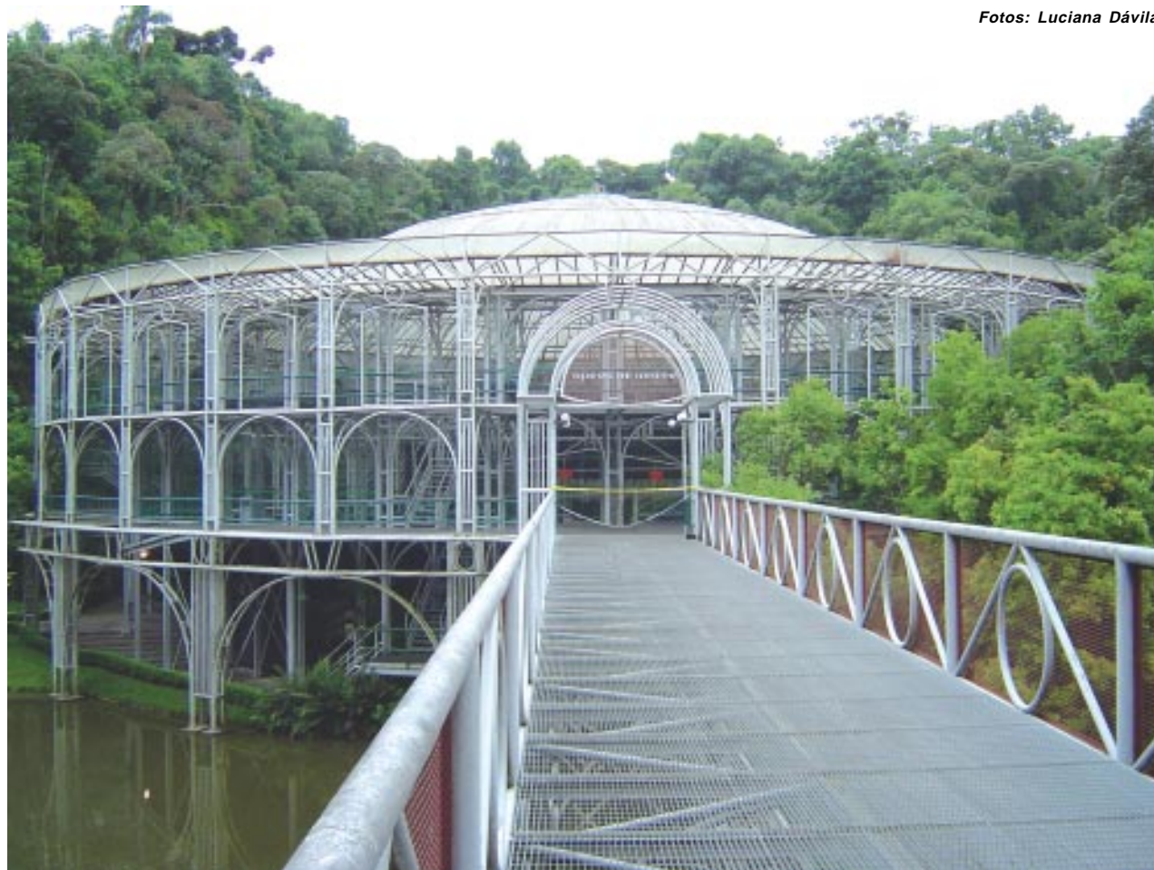
Famoso teatro Opera de Arame. Inaugurado em 1992, rapidamente se tornou um dos cartões postais da cidade

Localizada próxima ao Jardim Botânico e ao centro da cidade está a estação ferroviária. Do local saem trens que fazem o percurso turístico Curitiba-Morretes. Os comboios descem a Serra do Mar, serpenteando as encostas rochosas e proporcionando aos turistas vistas de belíssimas quedas d'água (a mais famosa é a Véu de Noiva), de precipícios altíssimos e de maravilhosas obras de engenharia, como túneis e viadutos que foram construídos para abrir caminho