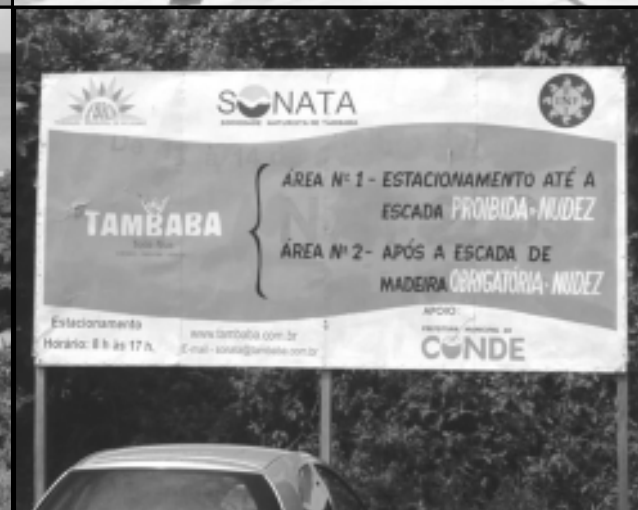
Em cima: marco e placa na Ponta do Seixas, ponto mais oriental de todas as Américas. Embaixo: Praia e painel indicativo em Tambaba

está muito bem representada nos restaurantes da capital. Dentre os pratos característicos do lugar, destacam-se a buchada de bode, a carne de sol, a macaxeira, a cabidela e o