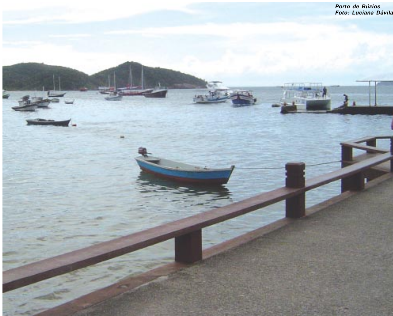
Porto de Búzios

Búzios adquiriu fama internacional nos anos 1960, quando a atriz francesa Brigitte Bardot visitou a cidade e se encantou com suas praias. A partir de então, muitos visitantes estrangeiros chegam à cidade, em especial os da Argentina. Os portenhos, hoje, detêm boa parte do comércio local. Muitos hotéis, pousadas, restaurantes e lojas pertencem a argentinos. Há na orla da cidade uma estátua de Bardot, a personalidade que abriu as portas para o turismo