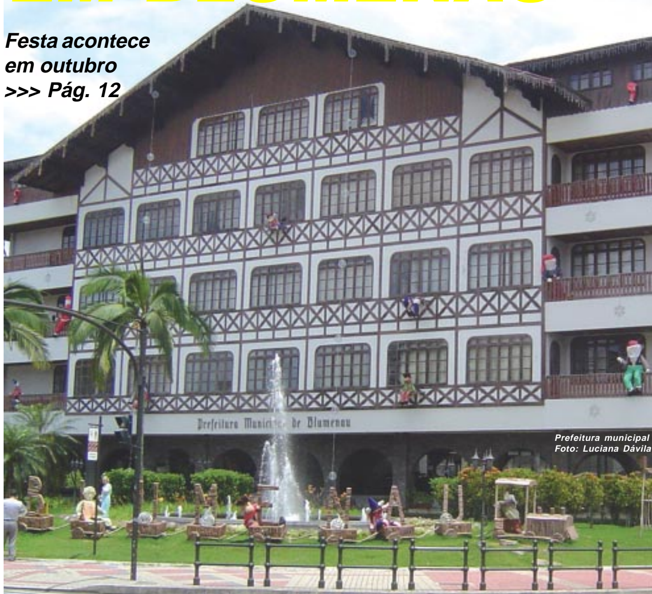
Prefeitura municipal