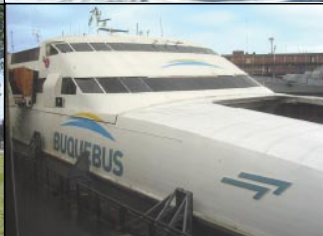
Em sentido horário, começando de cima, à esquerda: Sede do Banco La Nación, Rua Caminito, barco para Montevideu e a Casa Rosada

pesos (moeda argentina), pois o preço é bastante salgado, contudo, o show oferece um saboroso jantar com vinho incluído.