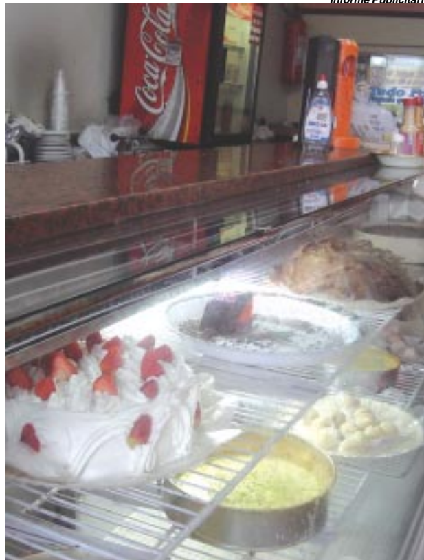
Nutriideal: delícias para qualquer ocasião

De uma ideia que foi lançada em uma turma do curso de Nutrição surgiu a Nutriideal, uma loja especializada em doces e salgados, que vem se tornando ponto de referência em sua área de atuação.