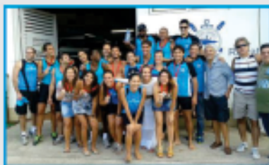
Foto: Regata de Remo

No dia 13 de julho foi realizada uma Regata de Vela na Baía de Guanabara , como comemoração ao aniversário do Clube e, no dia 20 de julho , uma Regata de Remo do Futuro na Lagoa , tendo um troféu comemorativo.