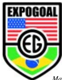
Marca da empresa Expogoal.

A empresa Expogoal trabalha em parceria com diversos treinadores e universidades, disponibilizando bolsas esportivas de até 100%,