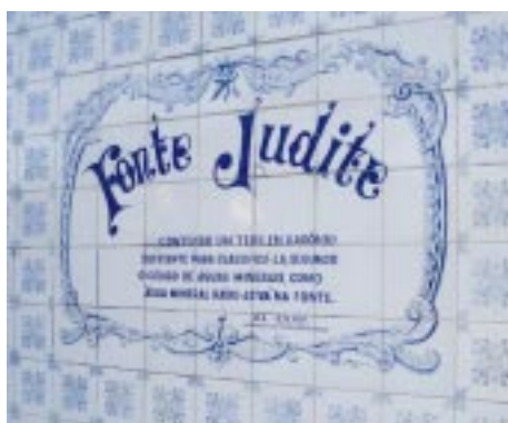
A tradicional fonte no centro da cidade.

Mirante do Soberbo. A vista do lugar faz com que o visitante que suba ou desça a serra obrigatoriamente tenha que parar. A Baía de Guanabara, pequenina, lá embaixo, o pico Dedo de Deus, bem