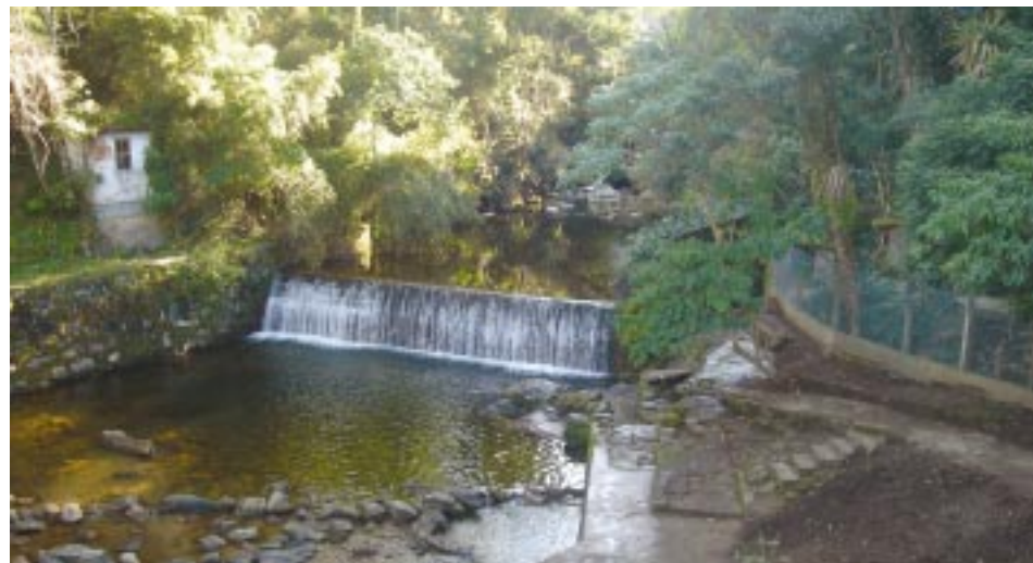
Não faltam fontes, cachoeiras, córregos e corredeiras.

Mirante do Soberbo. A vista do lugar faz com que o visitante que suba ou desça a serra obrigatoriamente tenha que parar. A Baía de Guanabara, pequenina, lá embaixo, o pico Dedo de Deus, bem