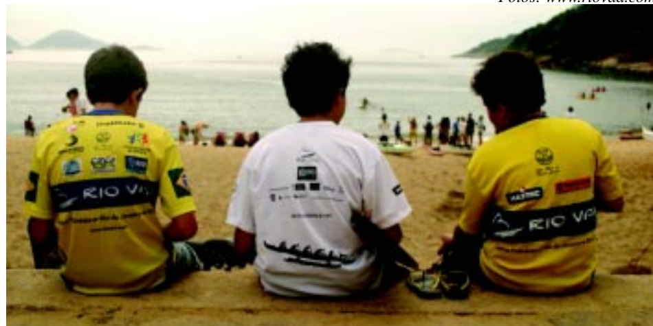
A presença das crianças mostra como o esporte é simples e divertido.