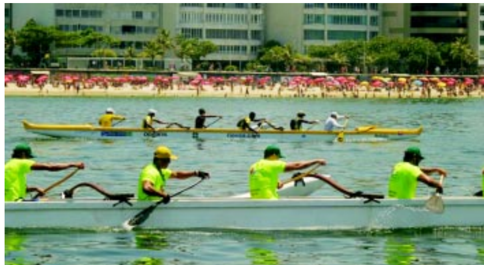
Competição do campeonato Sul-Americano de Va'a.

A canoagem, por exemplo, pode ser praticada em canoas, caiaques e wave-skis,