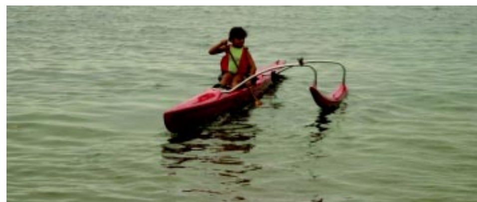
Diversão e saúde em um esporte olímpico.