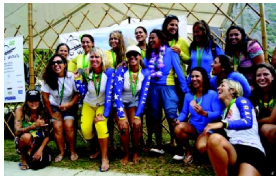
Mulheres bonitas fazem parte do cotidiano desse esporte.

Venha conosco desfrutar das belíssimas paisagens das ilhas e praias de Ilha Grande , de 01 a 04/03/2013.