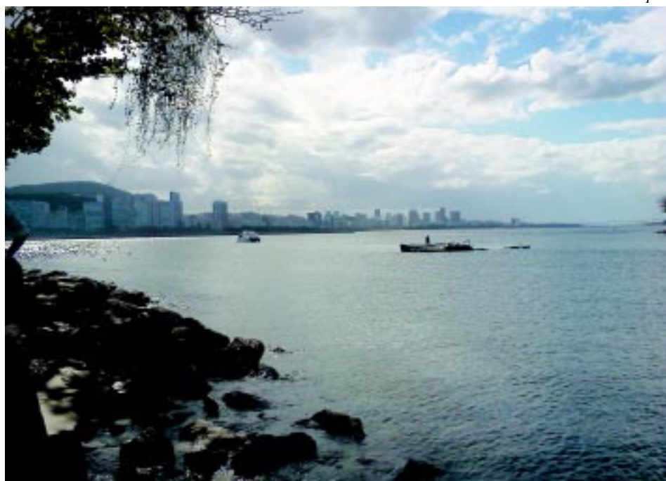
Cada cantinho da Urca possui belas paisagens.

Para os que gostam de um programa ao ar livre nada melhor do que passar um dia agradável na Quinta da Boa Vista, que proporciona também as opções de visita ao