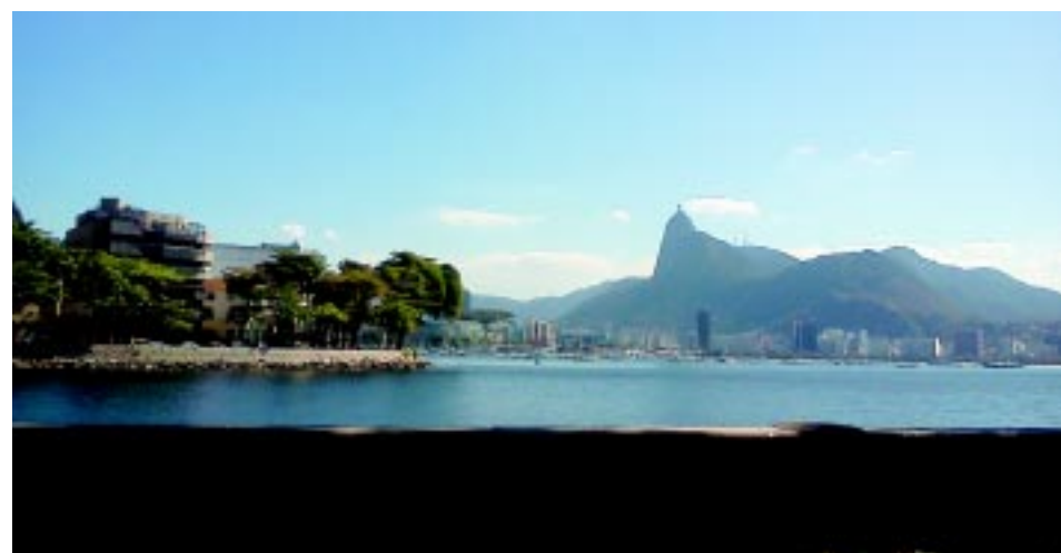
A Urca propicia vistas incríveis, como as praias do Flamengo e Botafogo.