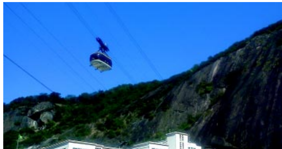
Bondinho que leva ao morro do Pão de Açúcar, na Praia Vermelha.

Venha conosco desfrutar das belíssimas paisagens das ilhas e praias de Ilha Grande , de 01 a 04/03/2013.