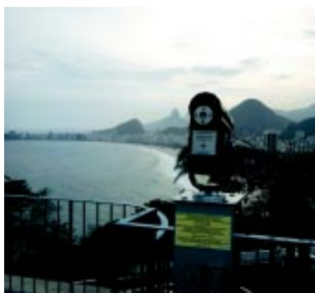
Luneta de frente para um cartão postal.

As lunetas deverão contar com placas informativas, que orientarão o visitante so-