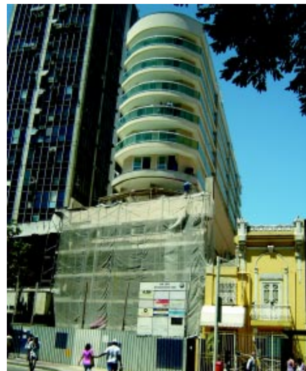
Condomínio em Botafogo: unidades vendidas antes do lançamento.

mostra a variação com mais realce, que seria uma redução da prestação, mas não tão grande, para R$ 7 mil reais, para ainda assim adquirir um imóvel mais caro, de cerca de R$ 600 mil.