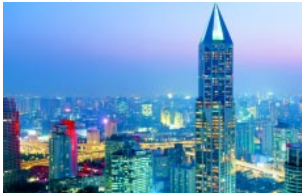
Xangai, na China, é outra cidade campeã em valorização.

significa dizer que na média, um imóvel com 100 metros quadrados custaria R$ 925 mil, sendo que existem bem mais caros dependendo da localização, pois em um mesmo bairro pode haver grande variação. Um exemplo é que um imóvel