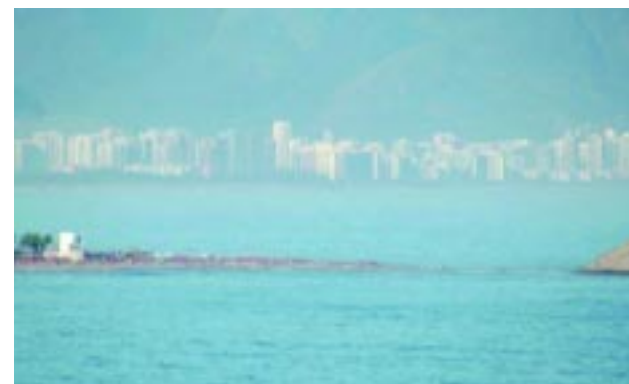
Barra da Tijuca, ao fundo: 14º bairro mais caro do Rio.

significa dizer que na média, um imóvel com 100 metros quadrados custaria R$ 925 mil, sendo que existem bem mais caros dependendo da localização, pois em um mesmo bairro pode haver grande variação. Um exemplo é que um imóvel