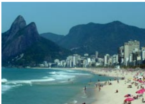
Ipanema e Leblon estão entre os mais caros do mundo.

Falando em juro, ele é um dos grandes responsáveis pelo aquecimento do mercado imobiliário nos últimos tempos. Isso porque houve uma redução significativa do mesmo ao longo dos anos, permitindo que uma maior quantidade de pessoas pudesse ter condições de pagar o financiamento de um imóvel ou, simplesmente, comprar um imóvel melhor pagando o mesmo que pagaria por uma casa ou apartamento mais simples no passado.