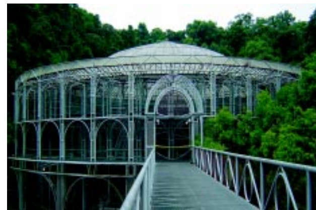
Opera de arame.

Além das belezas naturais, Curitiba é nacionalmente conhecida por ser revolucionária em vários aspectos de transportes urbanos, como, por exemplo, em seus sistemas de ônibus inovadores, tidos como dos mais modernos do Brasil. O passageiro entra em um ponto “tubo” (uma espécie de aquário) e paga a passagem. A partir daí ele pode utilizar um ou mais ônibus, pegando-os nesses terminais de integração, que estão localizados em vários bairros da cidade e de sua região metropolitana.