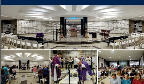
fotos da Capela

Venda de Nichos para guarda de restos mortais na Catedral