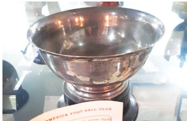
Simples, raro e valioso. A taça do Mundial do America.

cal diversas vezes até chegar à Rua Campos Sales, 98, mais tarde renumerado para 118, no bairro da Tijuca.